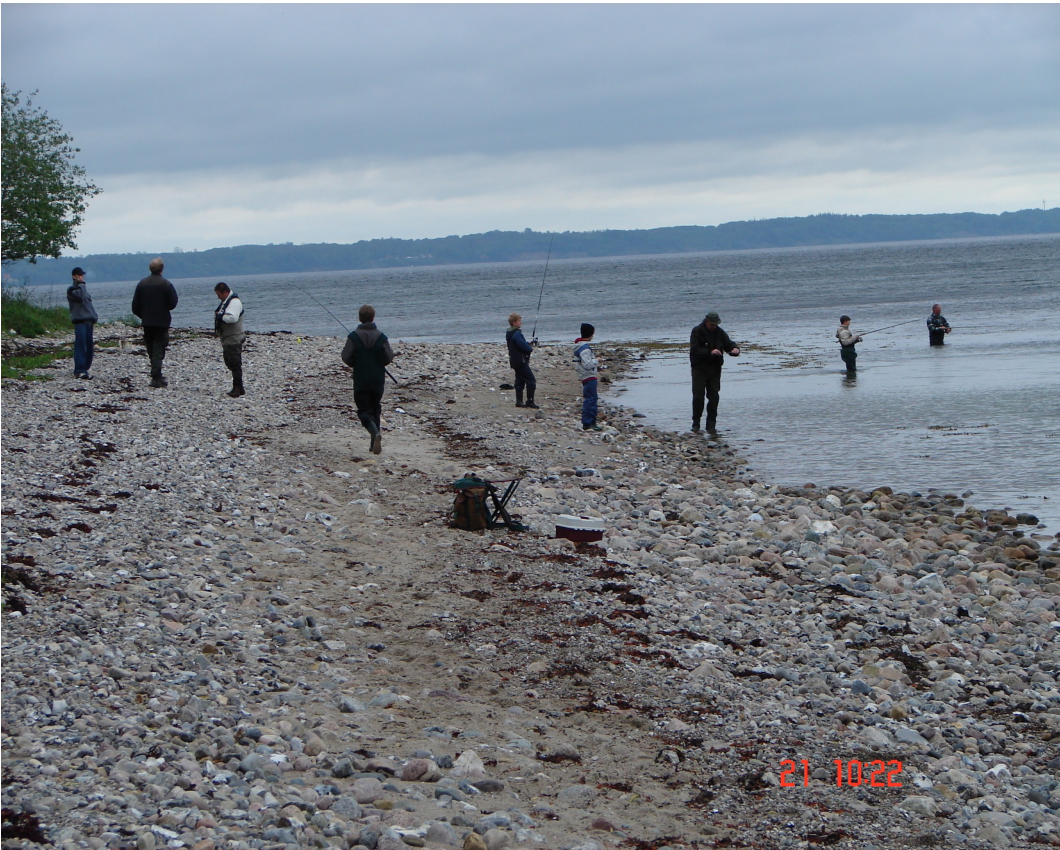
Fiskeskole efter Hornfisk ved Naldtang

A A B E N R A A S P O R T S F I S K E R F O R E N I N G